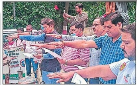
महापौर, नगर आयुक्त ने सभी को स्वच्छता की शपथ दिलाई गई।

बरेली (आज समाचार सेवा)। स्वच्छता ही सेवा कार्यक्रम को वृहद जन-सहभागिता के साथ मनाए जाने हेतु स्वभाव स्वच्छता, संस्कार स्वच्छता थीम पर 15 दिवसीय स्वच्छता ही सेवा कार्यक्रम दिनांक 17.09.2024 से 02. 10.2024 तक मनाया जा रहा है जिसके अंतर्गत 155 घंटे का नॉन-स्टॉप महासफाई अभियान आज दिनांक 27.09.2024 को नगर निगम बरेली के अलग अलग वार्डी में विशेष सफाई अभियान चलाया गया साथ ही मलिन बस्तियां, ब्लैक स्पॉट, नालिया आदि साफ कराए गए।इसके साथ-साथ स्वच्छता ही सेवा के अंतर्गत आज ऐसे घरों को चिहिंत किया गया जो डोर टू डोर को कचरा अलग अलग कर दे रहे है, घरेलू कंपोस्टिंग कर रहे हैं, अपने घर के सामने और पिछले हिस्से को स्वच्छ रखने का प्रयास दैनिक रूप से करते हैं इन्हें (स्वच्छ घर) मॉडल घरों के रूप में स्वच्छ सितारा के नाम से पुरस्कृत किया गया। जिसे निदेशालय में लाईव मॉनीटरिंग पर भी दर्शाया गया।अभियान का उद्देश्य नगर में स्वच्छता बनाए रखना साथ ही साथ अपने स्वच्छता संस्कार,स्वच्छता व्यवहार से सम्बन्धित रहा।