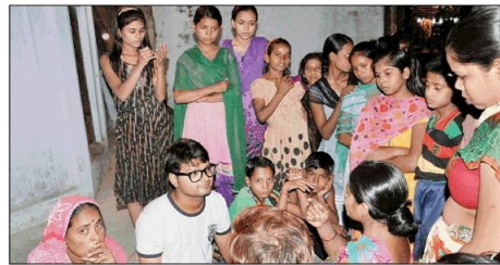
राम जानकी मंदिर के पास पहुंचे एजेंसी की टीम ने लोगों से बातचीत की।

स्मार्ट सिटी में स्लम एरिया को बेहतर तरीके से डेवलप करने पर जोर रहेगा। स्लम में रहने वाले लोग क्या सोचते हैं, कंसल्टेंट एजेंसी इसको भी जानने में लगी है। जागरण मुहिम को न केवल एजेंसी की टीम ने सगढ़ना की बल्कि उस मुहिम को साथ लेते हुए शहर के स्लम एरिया में पहुंच रहे हैं। टीम के सदस्य