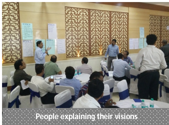
People explaining their visions