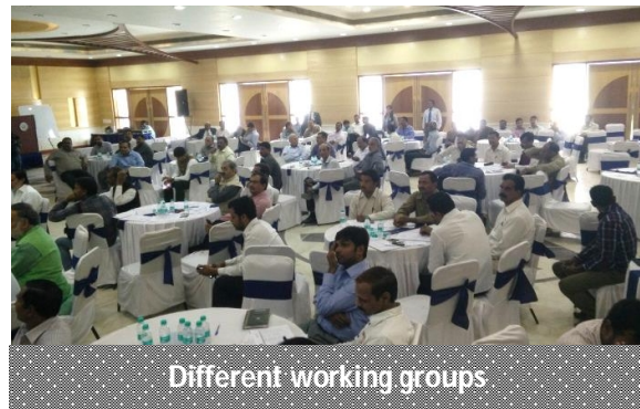
Different working groups