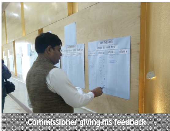
Commissioner giving his feedback